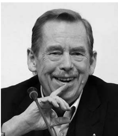
Obr. 7: Václav Havel

http://commons.wikimedia.org/wiki/File:-V%C3%A1clav_Havel_cut_out.jpg