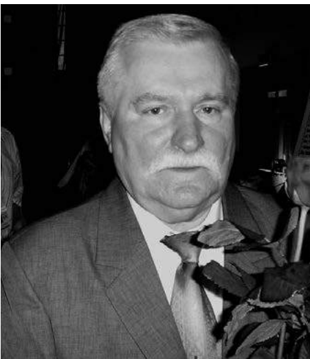
Obr. 3: Lech Wałęsa

http://sk.wikipedia.org/wiki/S%C3%BAbor:RIAN_archive_359290_Mikhail_Gorbachev.jpg - Yuryi Abramochkin, 1986