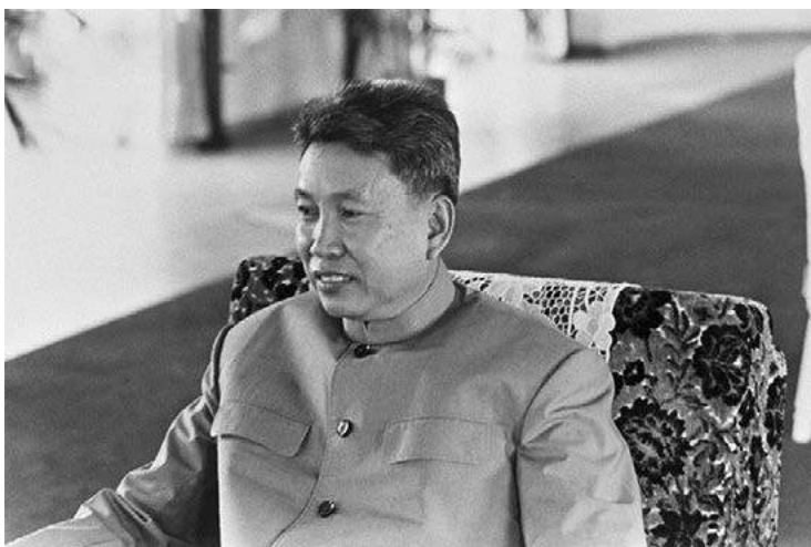
Obr. 10: Kambodžský diktátor, vodca Červených Kmérov Pol Pot http://sk.wikipedia.org/wiki/S%C3%BAbor:PolPot.jpg unknown, 1978