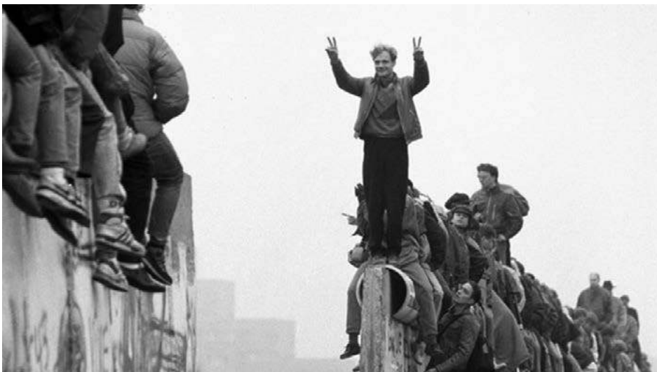
Obr. 6: Búranie berlínskeho múru

http://udalosti.noviny.sk/zo-zahranicia/09-11-2009/vyrocie-pad-berlinskeho-muru-jednou-z-najdolezitejsich-udalosti-20-storocia.html