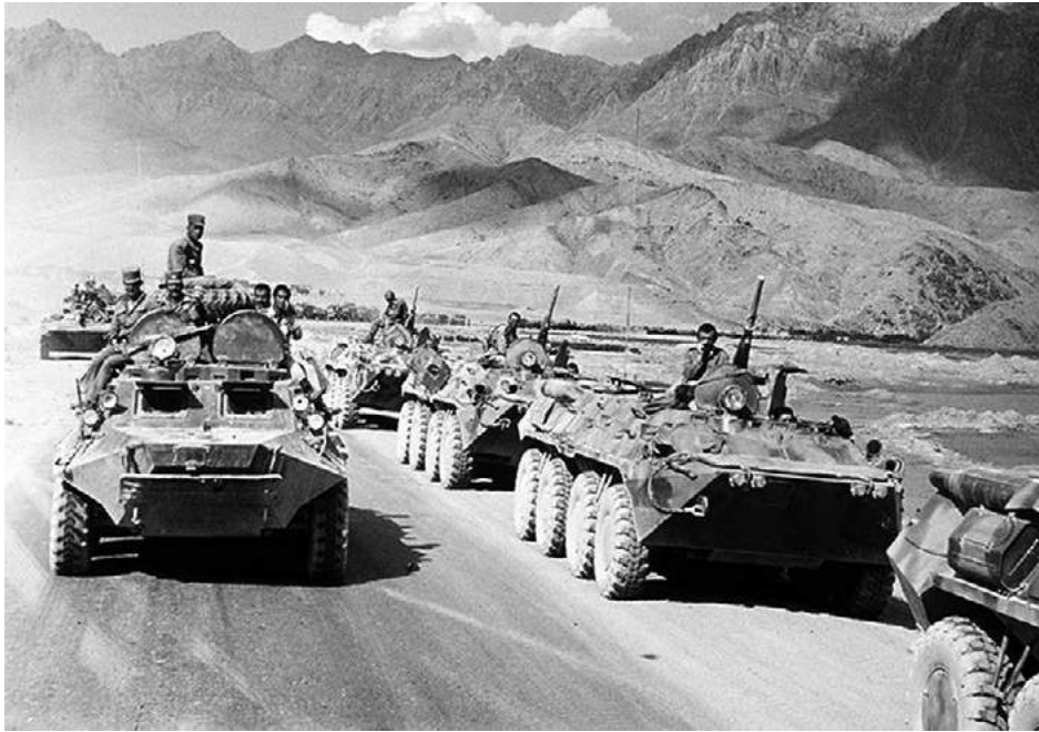
Obr. 8: Odchod sovietskych vojsk z Afganistanu http://sk.wikipedia.org/wiki/S%C3%BAbor:Evstafiev-afghan-apc-pas-ses-russian.jpg Mikhail Evstafiev, 1988