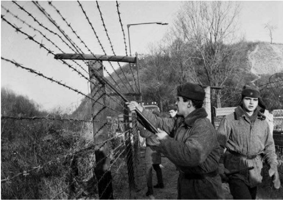
Obr. 5: Od ranných hodín začali 11. decembra 1989 vojaci Útvaru veliteľstva pohraničnej stráže Bratislava odstraňovať žienjotechnické zátarasy v hraničnom pásme pri Devíne.

http://www.teraz.sk/fotodennik/nezna-revolucia-1989-v-retrospektive/30691-fotografia.html#/fotodennik/fotografia/30691