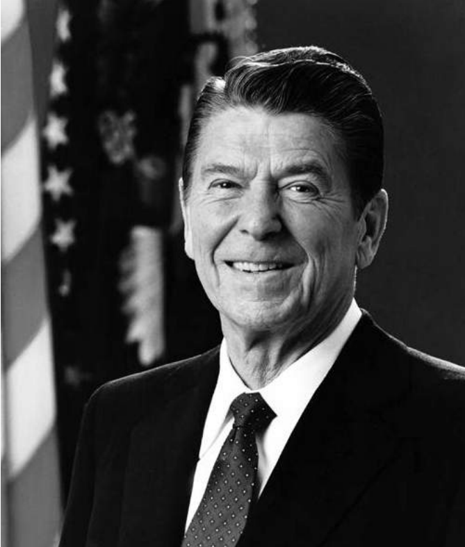
Obr. 1: Ronald Reagan

http://sk.wikiquote.org/wiki/Ronald_Reagan