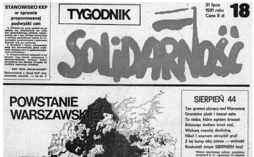
Obr. 4: Ilegalný týždenník hnutia Solidarita (Poľsko)

http://sk.wikipedia.org/wiki/S%C3%BAbor:Lech_Walesa.jpg - Slawek, 2007