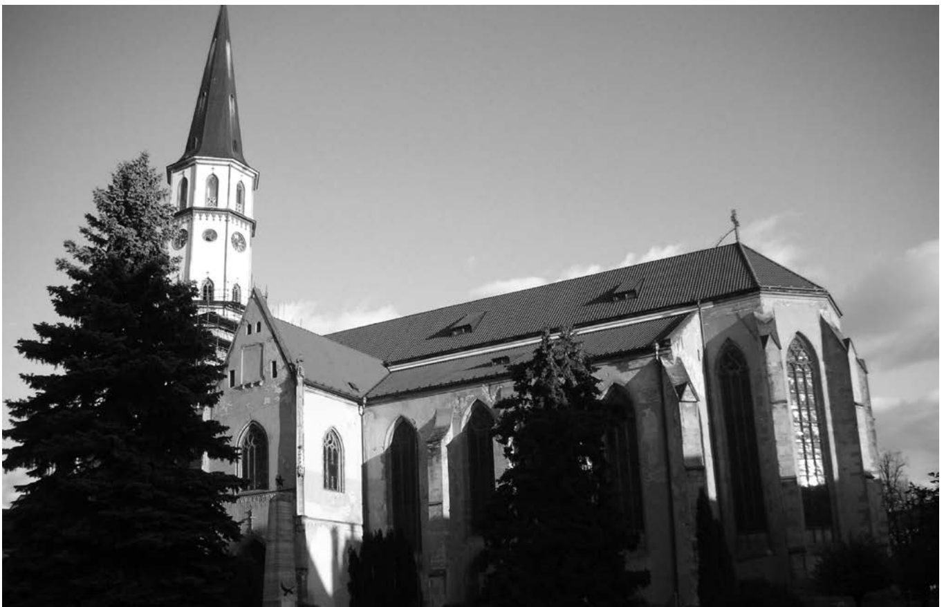
Chrám sv. Jakuba v Levoči