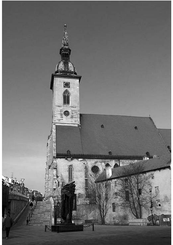
Dóm sv. Martina v Bratislave