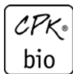
Prírodná bio kozmetika ČESKÁ REPUBLIKA