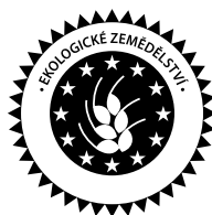
Ekologické poľnohospodárstvo EURÓPSKA ÚNIA