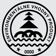
Environmentálne vhodný produkt SLOVENSKO